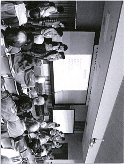
第7回図上訓練の様子